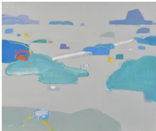
《AMAKUSA》2021年 油彩・キャンバス *本展には不出品

大山智子 Tomoko Oyama http://ateliercarre.info/