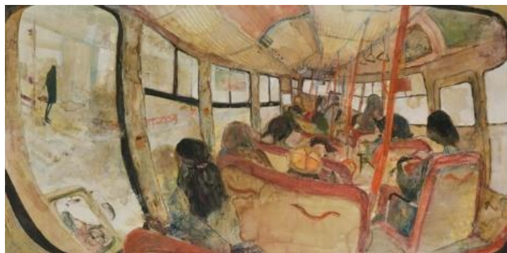
《26番地を曲がる頃》2022年 日本画材・パステル・片栗粉・珈琲・キャンバス *本展には不出品