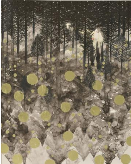
《光の森》2021年 紙本彩色