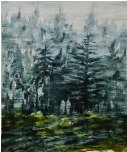
《whispering》2022年 油彩・キャンバス