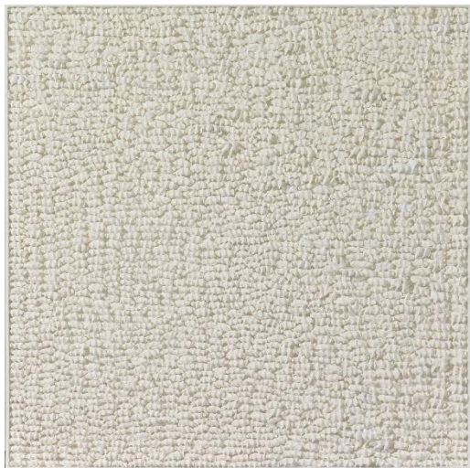
《あまりにも断片的な》2023年 石膏・キャンバス