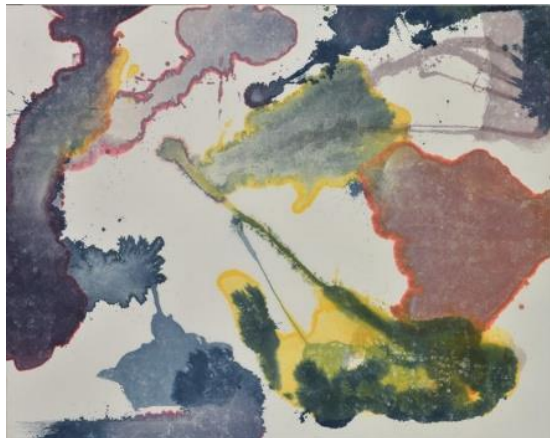
《溶けて》2023年 可溶性建築染料・蠟染め・綿布・パネル