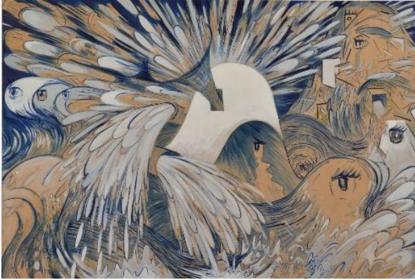
《顕現(仮)》2022年 アクリル・クラフト紙・木製パネル