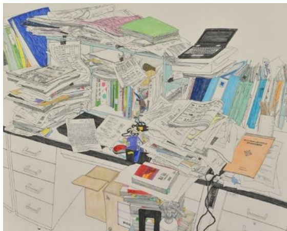
《探究》2023年 墨・ペン・水干絵具・和紙・パネル