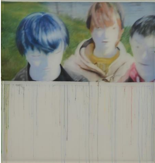
《Still milky_tune #4》2022年 アクリル・ポリエステル布

吉田桃子 Momoko Yoshida https://momokoyoshida.com/ 【Instagram】_momokoyoshida_