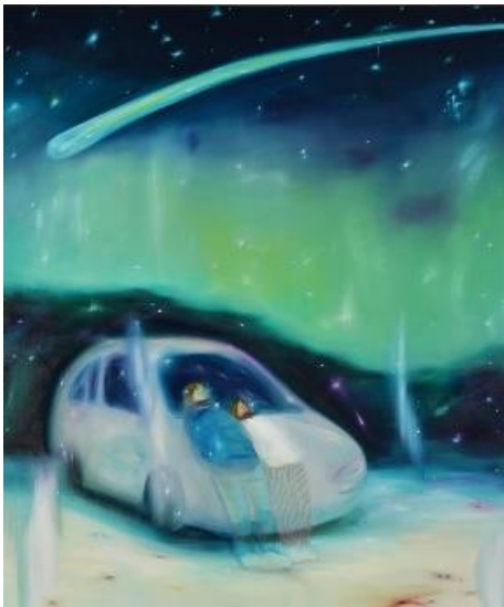
《星を見た日》2021年 油彩・キャンバス