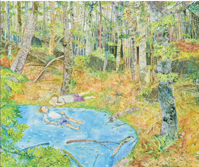
(右上) FACE2024グランプリ 津村 光璃 Hikari Tsumura 《溶けて》(部分) 2023年 可溶性建築染料・染色め・綿布・パネル 160×200cm