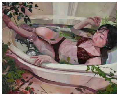
【優秀賞】 春日 佳歩 《必要条件》2024年 油彩・キャンバス 130×162cm