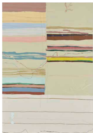
【優秀賞】 HUANG YUQI 《物事の秩序II》2024年 アクリル・キャンバス 162×112cm