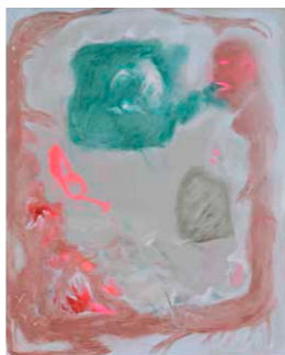
【優秀賞】 竹内 美樹 《祖母宅の庭》2024年 油彩・キャンバス 162×130cm